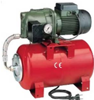
Groupe de surpression avec pompe horizontale

La réserve d'eau du ballon évite les démarrages intempestifs de la pompe.