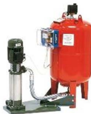
Groupe de surpression avec pompe verticale